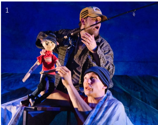
1 Le merveilleux voyage de Réal de Montréal 2 Mon petit prince 3 LoveStar